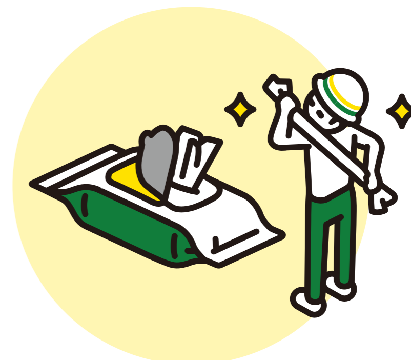
からだ 体ふき ウェットタオル