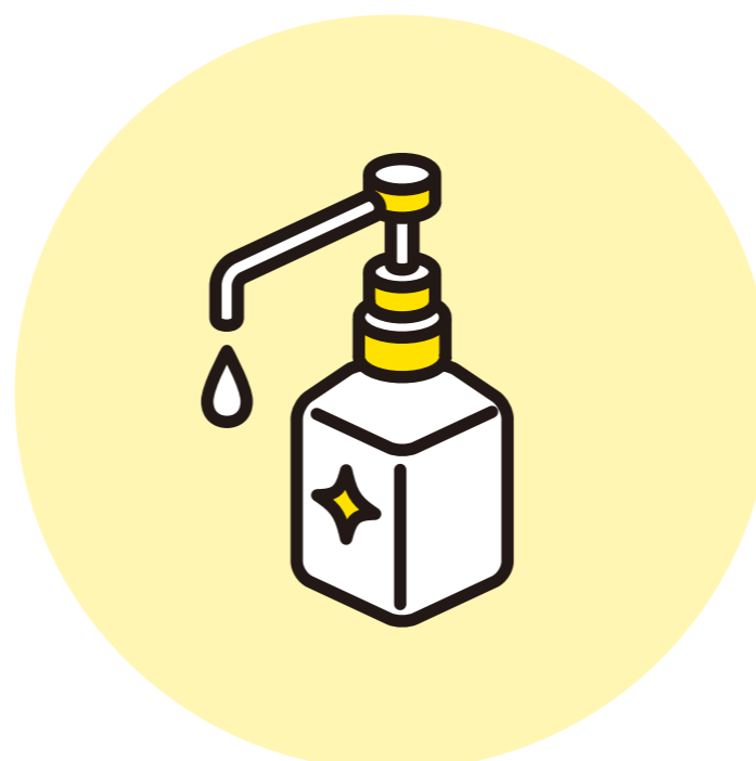
しょうどくざい 消毒剤