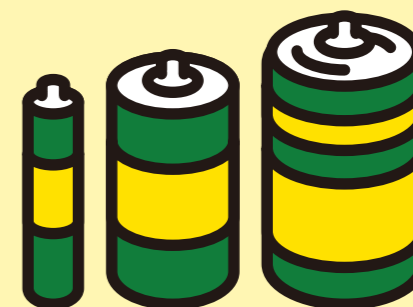
かん でん ち 乾電池