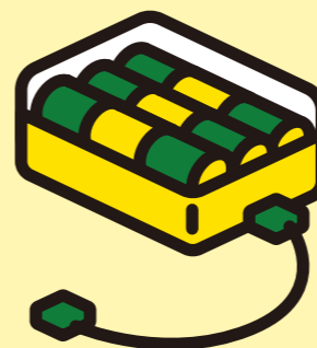
でん ち こう かん しき 電池交換式 バッテリー