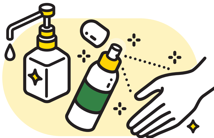
しゅ ししょうどく えき 手指消毒液