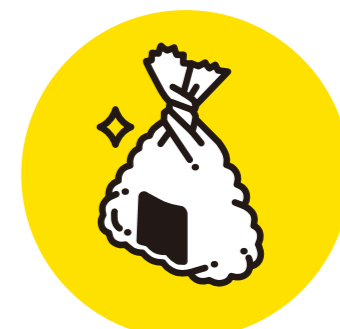
かつよう ラップの活用