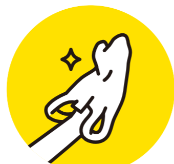
てぶくろが 手袋代わり