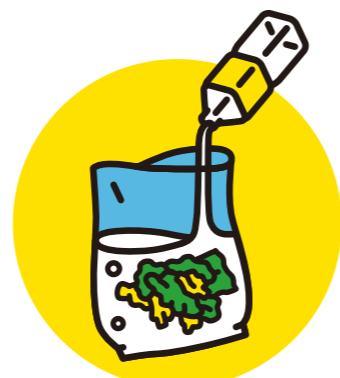
ぶくろちょうり ポリ袋調理