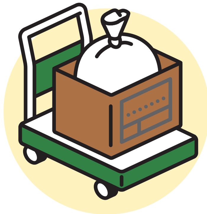
ぶくろ ばこ ポリ袋+ダンボール箱