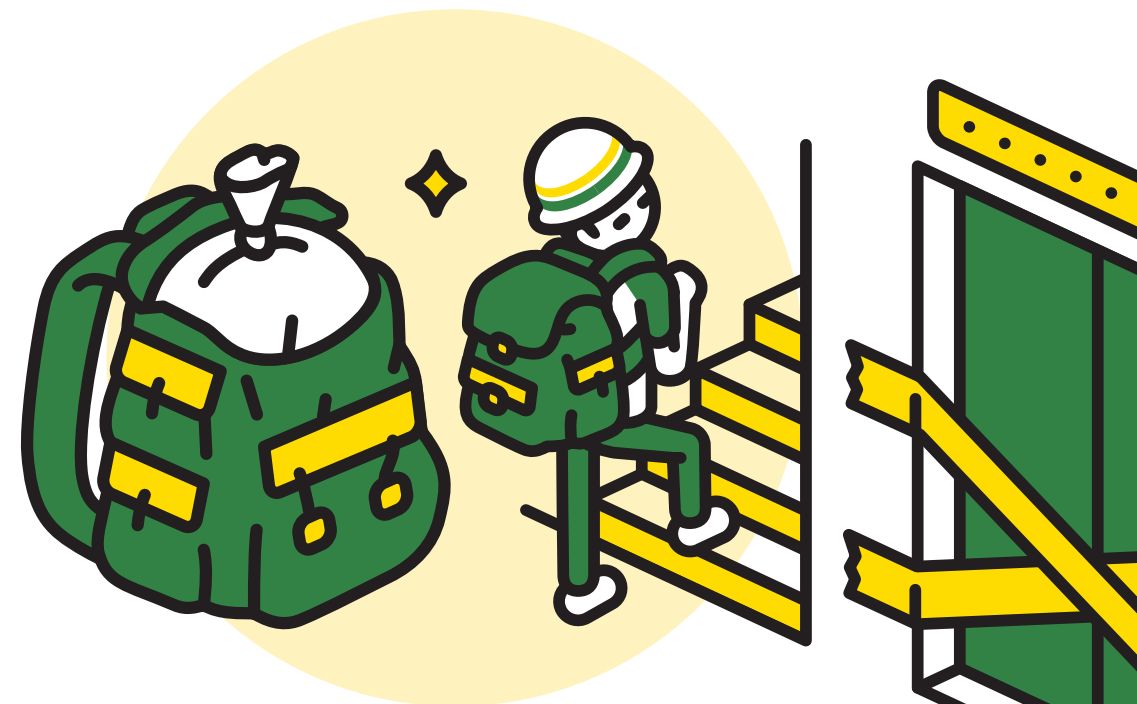
ぶくろ ポリ袋+リュック